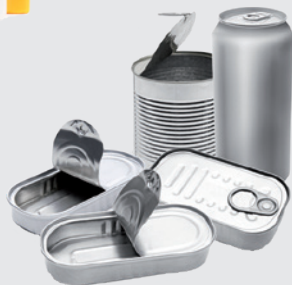
Dosen aus Metall oder Aluminium