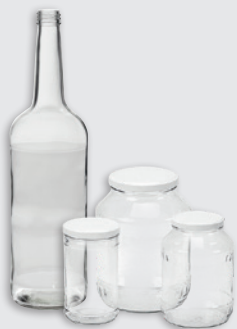
Glas bis Ø 70 mm